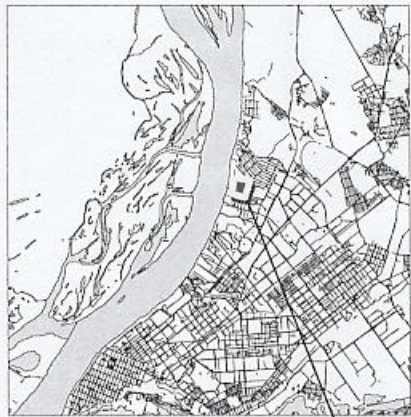
границы испрашиваемой территории