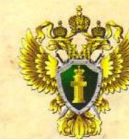
ПРОКУРАТУРА ГОРОДА САМАРЫ