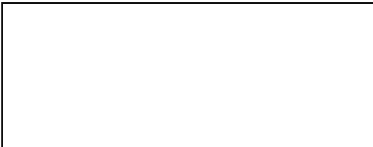
Схема установки и эксплуатации рекламной конструкции с указанием названий улиц и нумерации строений